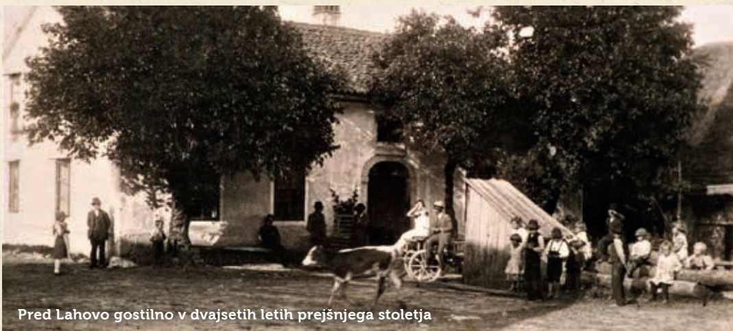
Pred Lahovo gostilno v dvajsetih letih prejšnjega stoletja

Besedilo: Marino Samsa; fotografiji: arhiv Nade Šantelj - Lahove.