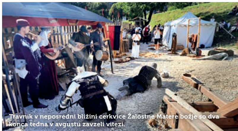
Travniki v neposredni bližini cerkvice Žalostne Matere božje so dva konca tedna v avgustu zavzeli vitezi.

Podeželsko društvo Kašča, ki letos praznuje desetletnico ustanovitve, je tretji in četrti konec tedna v avgustu organiziralo Srednjeveške dneve v Predjami.