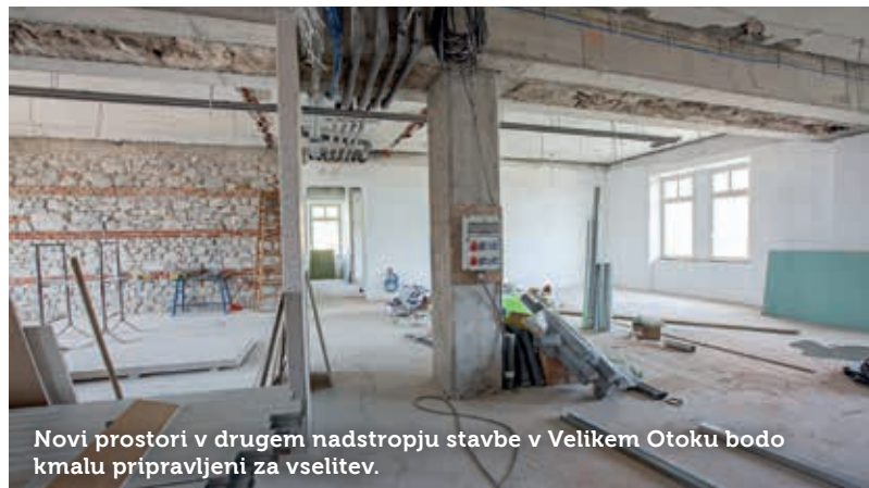
Novi prostori v drugem nadstropju stavbe v Velikem Otoku bodo kmalu pripravljeni za vselitev.

Pri vključevanju v nacionalne programe na področju podjetništva so letos pomagali osmim šolam iz regije, podporo pa jim bodo nudi-