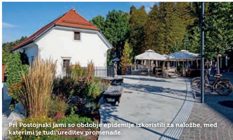
Pri Postojnski jami so obdobje epidemije izkoristili za naložbe, med katerimi je tudi ureditev promenade.

besedah Špele Peric so naši gostje v veliki meri ljubitelji narave in manj masovno obiskanih turističnih točk, zato je veliko povpraševanja po naravnih parkih, kot je Notranjski park z Rakovim Škocjanom, Cerkniskim jezerom, Križno jamo in na drugi strani Škocjanskimi jamami. Med najbolj zaželenimi vsebinami pa so opazovanje medveda in drugih zverí ter ptic, ribolov, fotolov in trekingi.