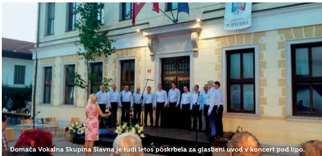
Domača Vokalna Skupina Slavna je tudi letos poskrbela za glasbeni uvod v koncert pod lipo.