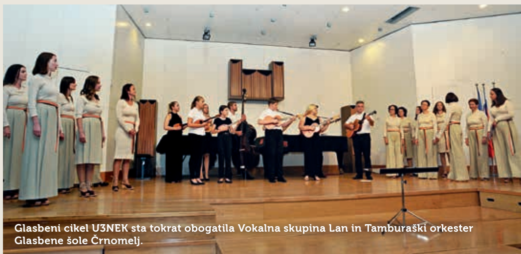
Glasbeni cikel U3NEK sta tokrat obogatila Vokalna skupina Lan in Tamburaški orkester Glasbene šole Črnomelj.

Koncert je odprl domači zbor pod vodstvom Matjaža Ščeka in odpel ljudski Kje so tiste stezice in Oblaki so rudeči v priredbi Hilari-