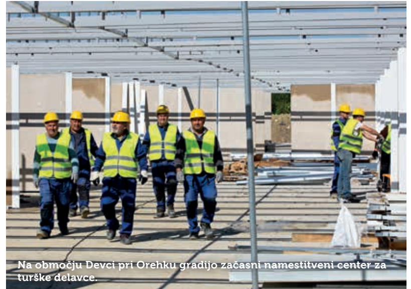
Na območju Devci pri Orehku gradijo začasni namestitveni center za turške delavce.