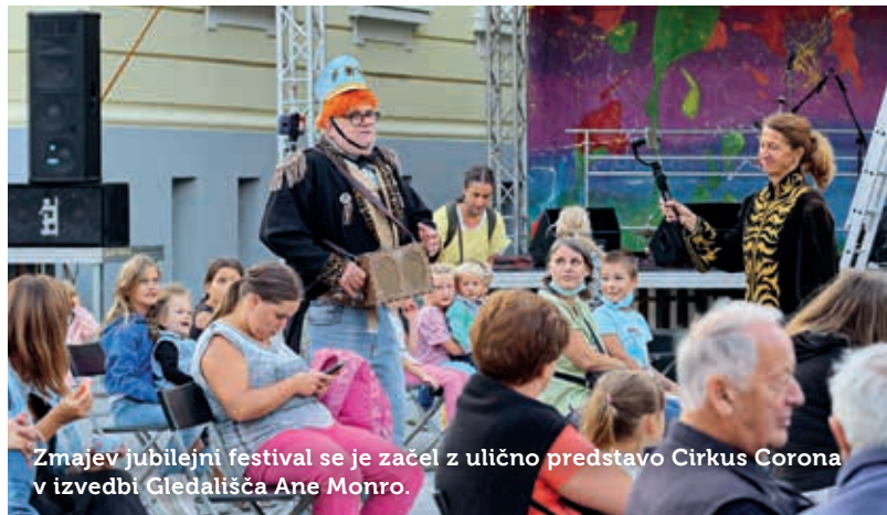
Zmajev jubilejni festival se je začel z ulično predstavo Cirkus Corona v izvedbi Gledališča Ane Monro.

Besedilo: Ester Fidel; fotografije: Aleksander Petrov in Tea Nagode.