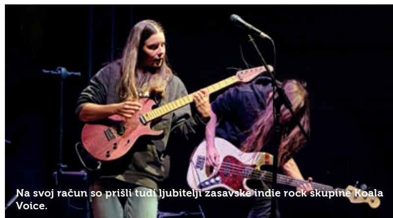
Na svoj račun so prišli tudi ljubitelji zasavske indie rock skupine Koala Voice.