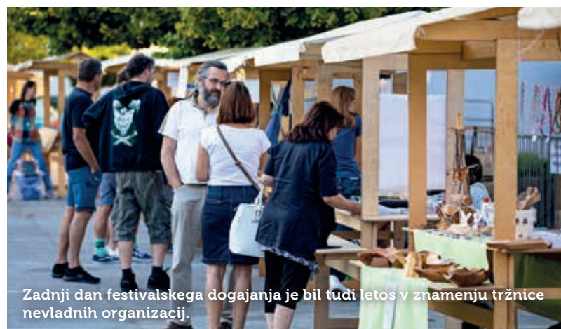
Zadnji dan festivalnega dogajanja je bil tudi letos v znamenju tržnice nevladnih organizacij.