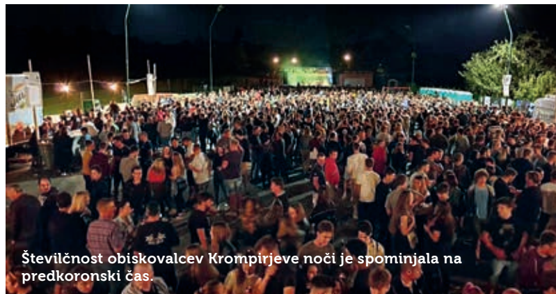
Številčnost obiskovalcev Krompirjeve noči je spominjala na predkoronarni čas.

Vsako leto tradicionalno izberejo lastnika največjega krompirja. Mo-