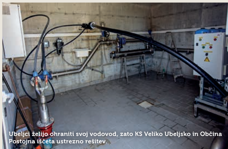
Ubeljci želijo ohraniti svoj vodovod, zato KS Veliko Ubeljsko in Občina Postojna iščeta ustrežno rešitev.

Krajani Velikega Ubeljskega so se s predstavniki Občine sestali v zadnjem mesecu dvakrat in kot kaže,