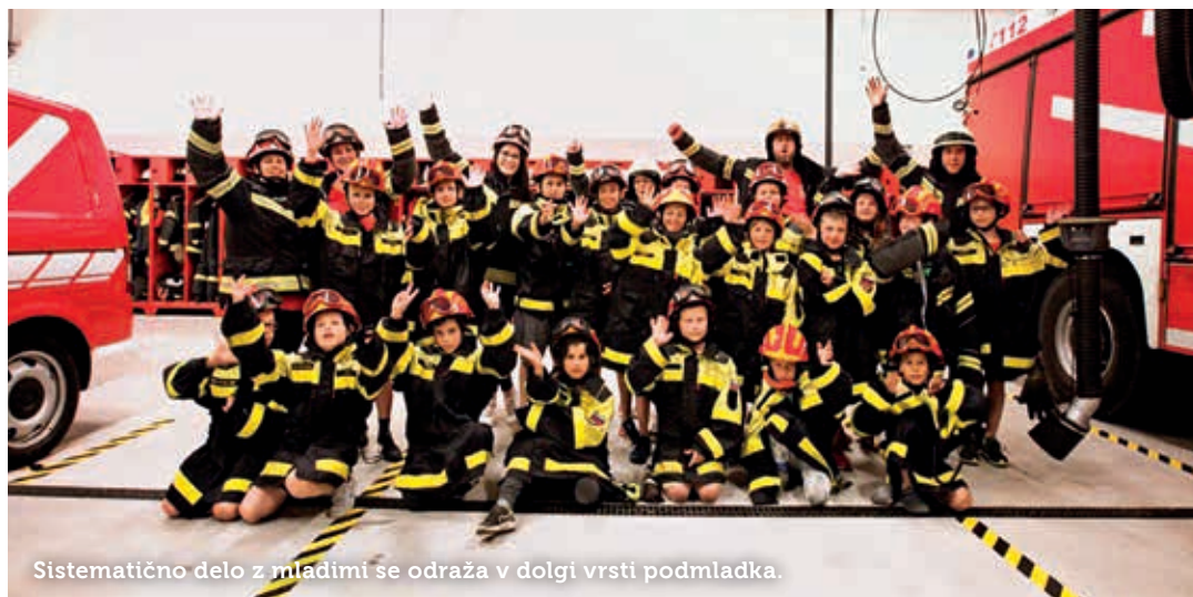
Sistematično delo z mladimi se odraža v dolgi vrsti podmladka.

Letos spomladi, po izboljšanju epidemioloških razmer, so mladi gasilci po daljšem premoru začeli z rednimi gasilskimi vajami. V juliju, času šolskih počitnic, so na veliko veselje mladincev uspešno izpeljali 2. mladinski gasilski tabor PGD Postojna. Udeležilo se ga je 23 otrok, od tega 12 pionirjev in 11 mladincev. Tridnevni tabor konec tedna je vključeval vse, kar nadobudni mladi gasilci potrebujejo. V izobraževalnem programu so se preizkusili v uporabi razpiral in škarij za rezanje zveržene pločevine, se v polni gasilski opremljeni udeležili nočne simulacije za primer intervencije požara na avtomobilu, si ogledali gasilski film in se udeležili kviza. Zabavnejši del so predstavljali kopanje v bazenu na dvorišču gasilskega doma, plezanje med krošnjami Pustolovskega parka v Postojni in obisk okoliške kmetije.