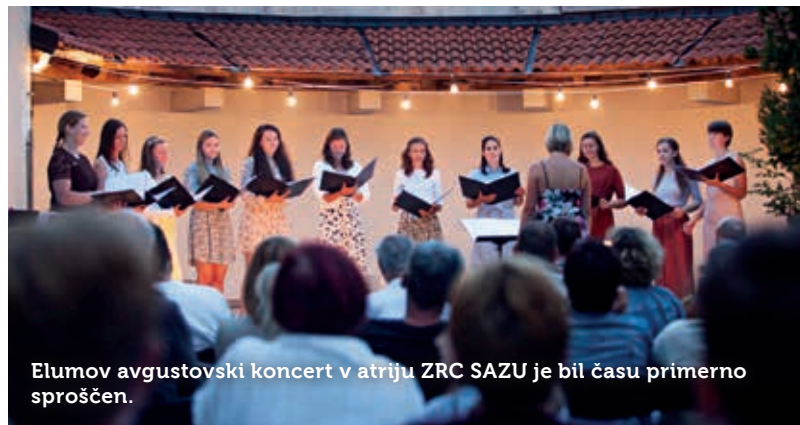
Elumov avgustovski koncert v atriju ZRC SAZU je bil času primerno sproščen.