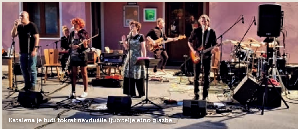
Katalena je tudi tokrat navdušila ljubitelje etno glasbe.

Športno kulturno društvo Orehek tradicionalno priredi za vaščane in zunanje obiskovalce v okviru projekta Večer KS Orehek konec avgusta glasbeni večer. V soboto, 21. avgusta, ko se je nasmejani dan prevesil v večer, je na odprtem prireditvenem prostoru pred kulturnim domom v Orehku obiskovalce počastila s svojim nastopom etno glasbena skupina Katalena.