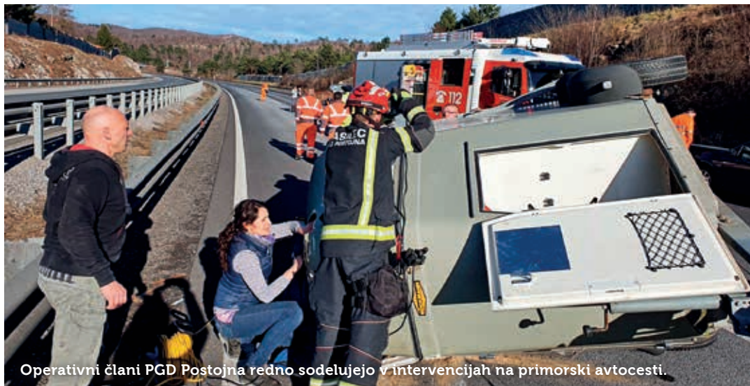
Operativni člani PGD Postojna redno sodelujejo v intervencijah na primorski avtocesti.