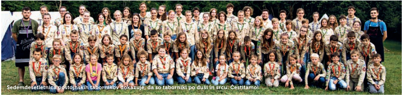
Sedemdesetletnica postojnskih tabornikov dokazuje, da so taborniki po duši in srcu. Čestitamo!